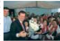
Prefeito Kassab e secretário Pesaro inauguram oficialmente o EIS Pari

A inauguração oficial foi no dia seguinte com a presença do prefeito Gilberto Kassab e secretário municipal de Assistência e Desenvolvimento Social, Floriano Pesaro.