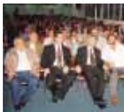
O auditório ficou inteiramente completo de convidados

que o presidente da Síria, Bashar al Assad, quer a paz e os direitos de liberdade, apoiando todas as forças de resistência árabe, entre elas o Iraque, Líbano e Palestina. “Não admitimos que alguém